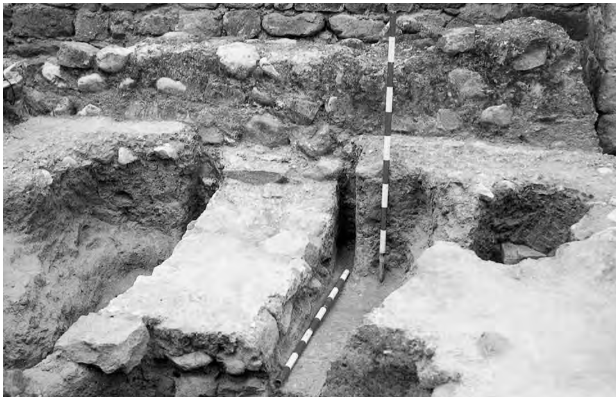
Figura 2. Paret nord del contracor als peus del temple; primera fase de l'edifici.

Abans de la segona fase, s'originà fora del temple un recinte rectangular, paral·lel a la façana meridional, amb la porta afrontada a la principal. La tècnica constructiva es basa en filades de petits blocs quadrangulars de pedra arenosa. Fins a l'època medieval, fins i tot un cop amortitzat, aquest recinte complia un paper estrictament funerari, a part d'exercir de lloc de pas en sentit nord-sud i possiblement est-oest. Fins a dos nivells de tombes d'adults s'enregistren en l'estratigràfica seqüència, la més reveladora de la qual és la inferior, que subjeu sota el paviment d' opus signinum de la segona fase, i a més ofereix algun sistema de senyalització. Tret d'una tomba de maçoneria, d'extrem arrodonit, encaixada a l'angle de la cambra meridional, la resta són de fossa i caixa de tegulae i imbrices a doble vessant, i s'ordenen paral·leles a les parets llargues (est-oest) de l'edifici.