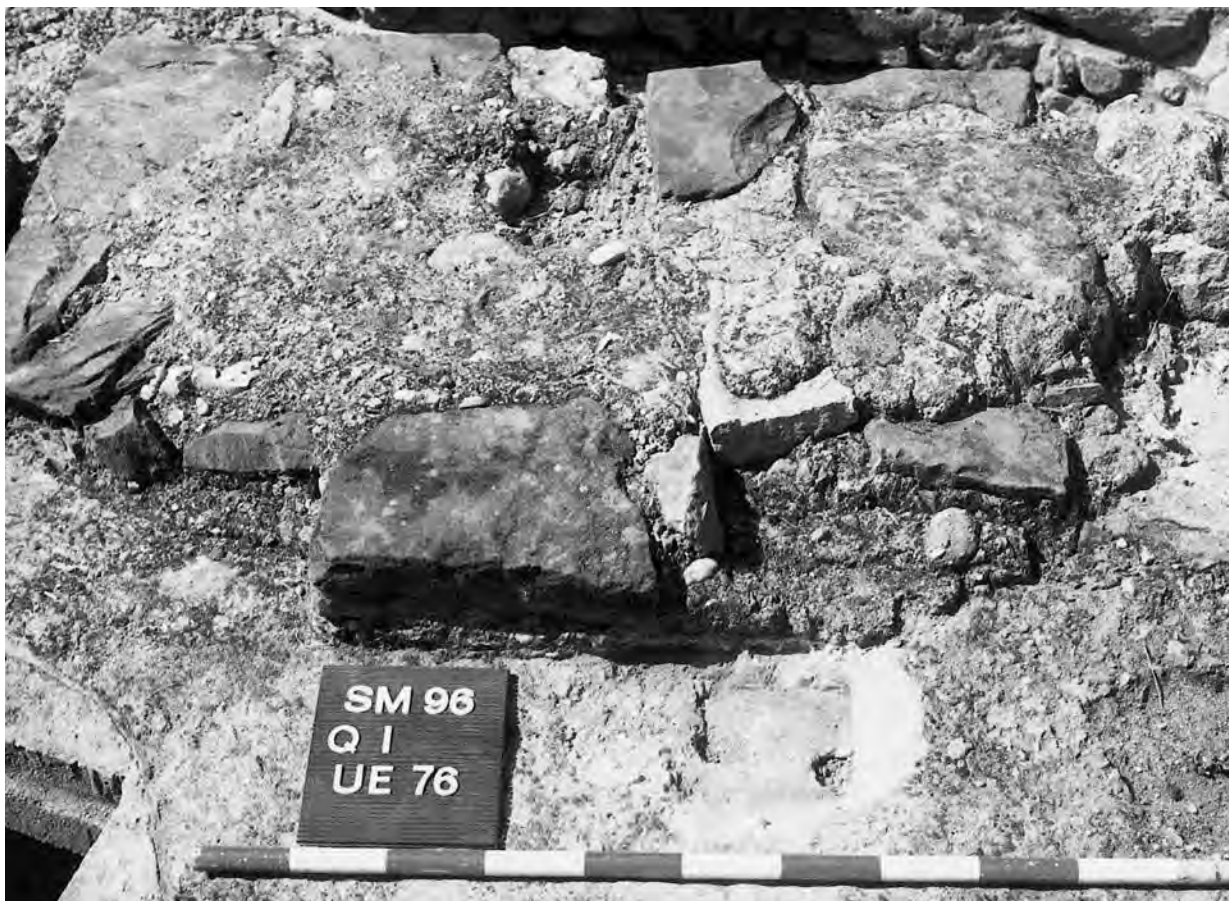
Figura 3. En primer terme, empremta quadrada sobre el paviment d' opus signinum , que correspon a una de les columnetes de l'altar de la segona fase.