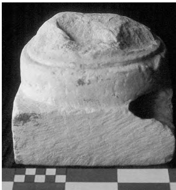
Figura 4. Basament de columneta, de marbre de Luni-Carrara, amb loculus en un angle.

Davant del santuari s'origina un espai quadrangular tancat, només dotat d'una porteta al